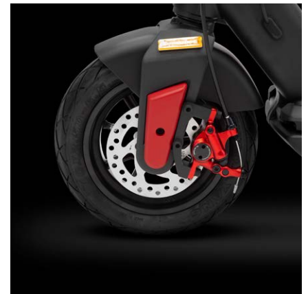
Freno a disco anteriore e posteriore