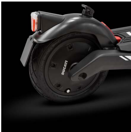
Motore 500W, Peak Power: 800W