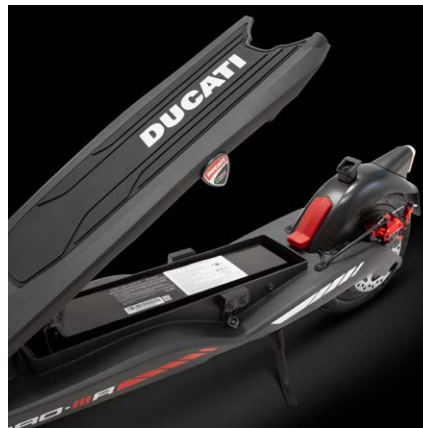
Fino a 55km di autonomia, batteria da 499Wh