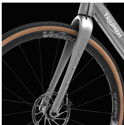
Forcella rigida in carbonio