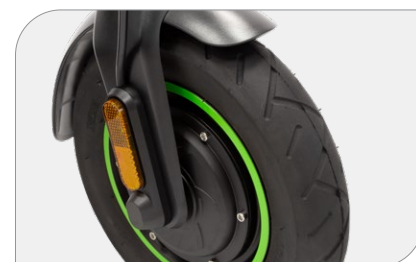
Pneumatici da 10" con camera d'aria