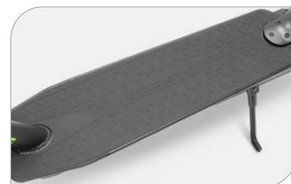
Batteria 259Wh: fino a 28km di autonomia