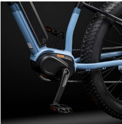
Moteur Bafang 36V, 250W, 80Nm