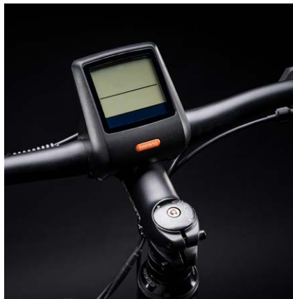
Écran LCD étanche de Bafang