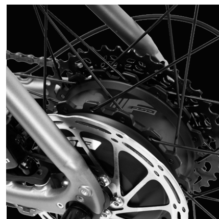
Moteur arrière FSA avec capteur de couple