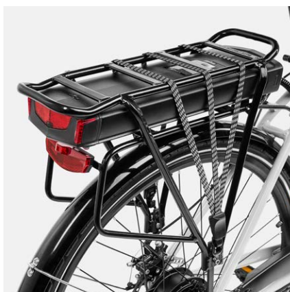
Portapacchi posteriore installato