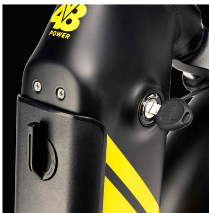
Fino a 80km di autonomia