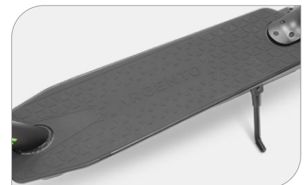
Batterie 259 Wh : jusqu'à 28 km d'autonomie