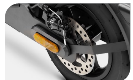
Système de freinage avec kers intégré