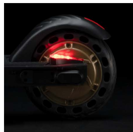
Moteur arrière sans balais de 250W