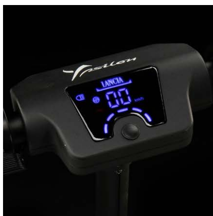
Affichage LED intégré