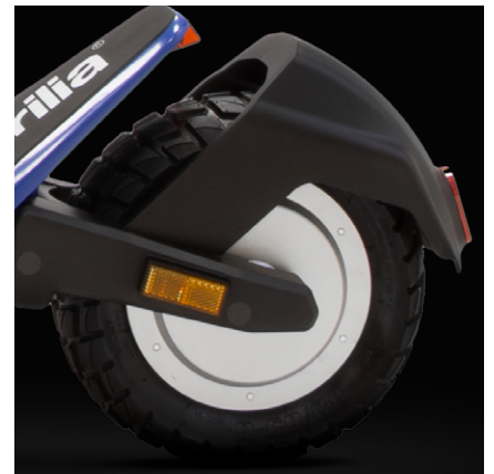
Motore da 350W, Peak Power: 550W