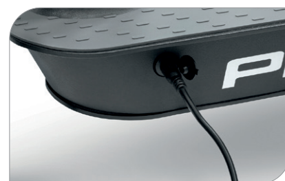
Batterie de 374.4 Wh avec KERS - Jusqu'à 40 km d'autonomie