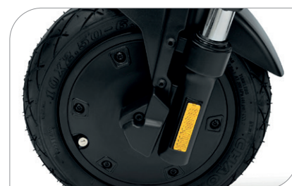
Moteur sans balais 350 W, 18,9 Nm