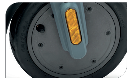
Motore brushless 350 W, 15 Nm