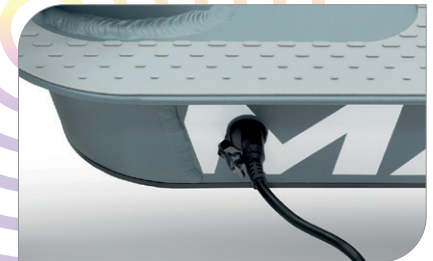
Batteria da 360 Wh, fino a 40 Km di autonomia