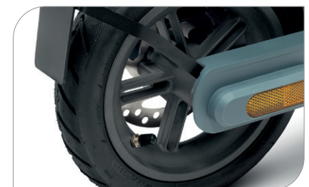
Pneumatici da 8,5" con camera d'aria