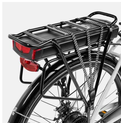
Porte-bagages arrière installé